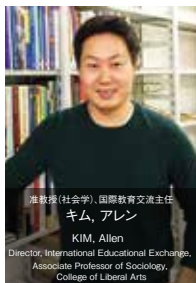
准教授(社会学)、国際教育交流主任