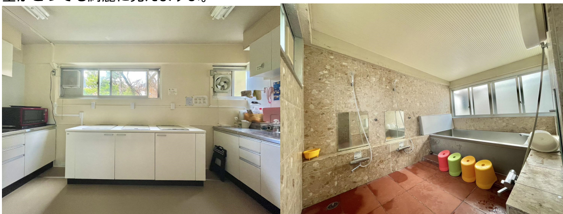
( 左 : キッチン、右 : お風呂 )

また、キッチンとお風呂の間にあるベランダには、屋上への秘密のはしごがあります。夜は星がとっても綺麗に見えますよ。