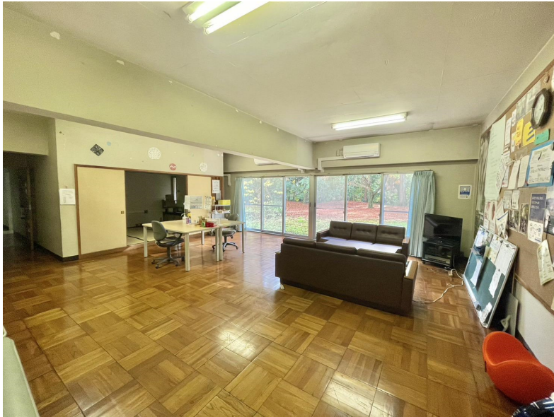
( ソーシャルルーム )