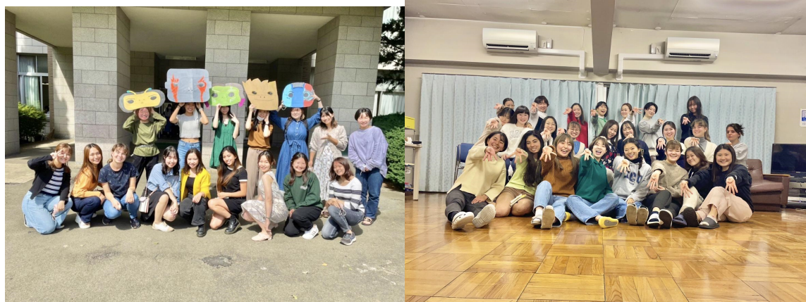
(第4女子寮のみんな)

そんな私の大好きな4女を少しでも知って欲しい、という気持ちでこの文章を書いています。最後まで読んでいってくださいね；)