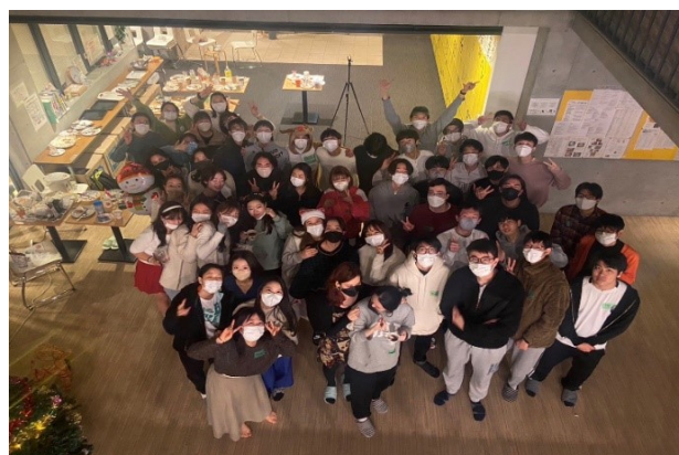
クリスマスパーティ